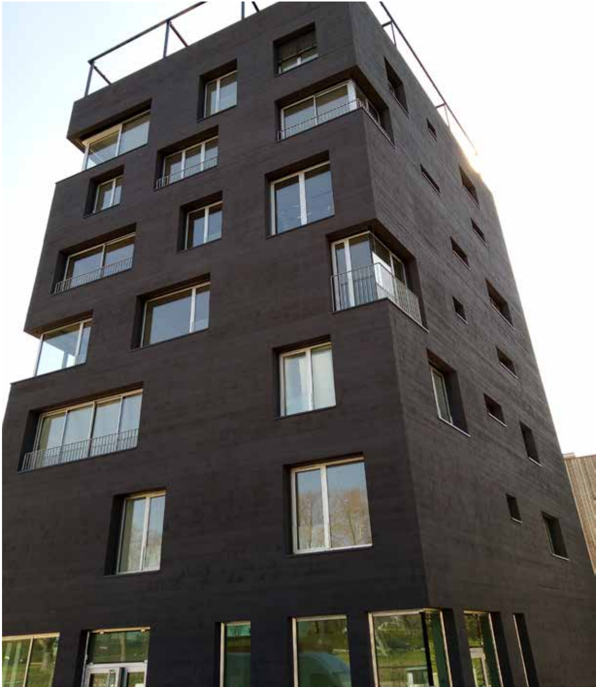
ZAC du Danube Strasbourg Toa Architectes Associés + Mayker