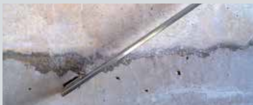
Béton neuf avec défauts à colmater