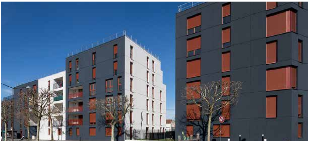
Résidence Acacia de Montreuil - Germak Architecture