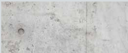
Béton neuf avec des imperfections mineures