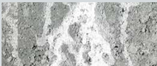
Béton neuf avec de grosses imperfections