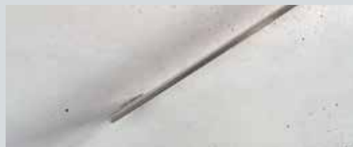
Zones colmatées ou forte égalisation ou finition minérale dans une teinte assortie