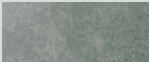
Imperfections ou finition fortement égalisée ou finition minérale dans une teinte assortie