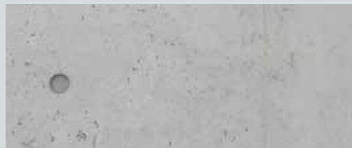
Surface minérale uniforme avec KEIM Lasure Concreton®